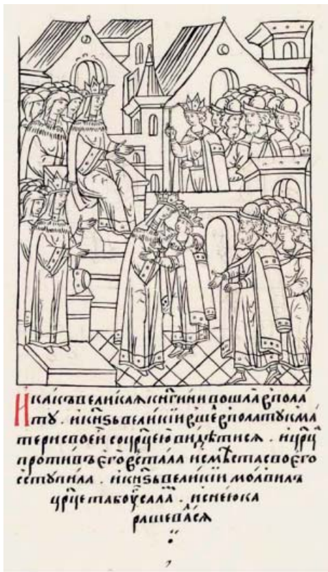
Рис. 3. Малолетний великий князь Иван IV (Грозный) и царица Фатьма-Салтан, супруга Шигалея (Шах-Али) – Царственная книга, л. 128 об.

Fig. 3. Grand Prince Ivan the Terrible as a child and the tsarina Fatma-Saltan, spouse of Shah-Ali (Shigaley) – Tsarstvennaya kniga (Royal book), fol. 128 r.