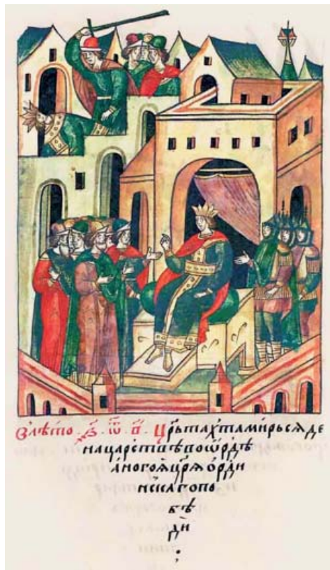
Рис. 2. Восшествие на престол Тохты (Тахтамира); сцена убийства Ногай – Первый Остермановский том Лицевого свода, л. 172.

Fig. 2. Tokhta (Takhtamir) ascends the throne; scene of assassination of Nogay – First Osterman volume of the Illustrated Chronicle, fol. 172 v.