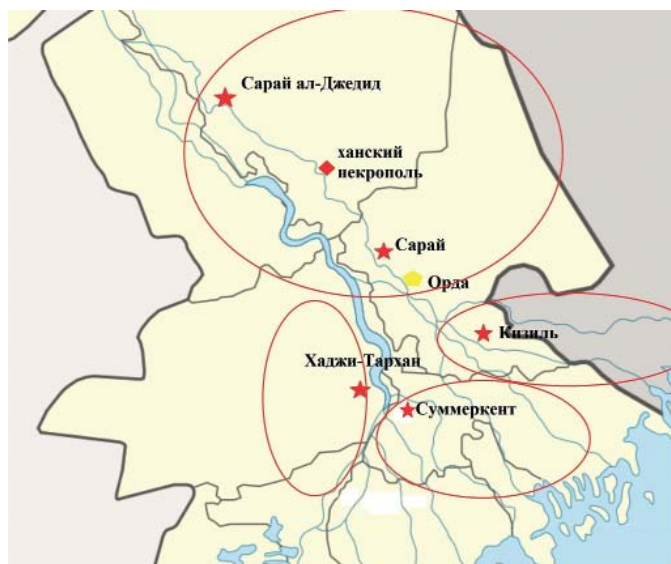
○ условная граница микрорегиона (округа, "белед") Хаджи-Тархан