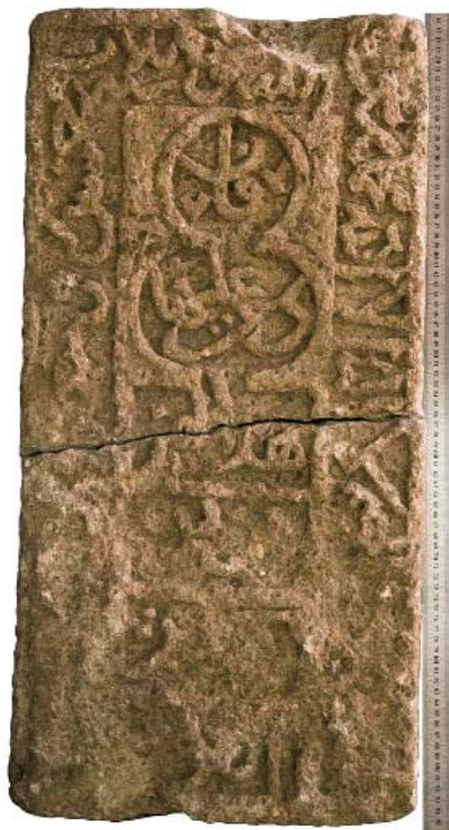
Рис. 3. Хаджи-Тархан. Надгробие, камень.

117. Поселение «Верхне-Лебяжье 1», находится на северной окраине села Верхне-Лебяжье на правом берегу реки Волги. Площадь памятника 50×40 м. В ходе осмотра территории памятника были обнаружены обломки круговой красноглиняной и сероглиняной керамики золотоордынского времени. Поселение входит в