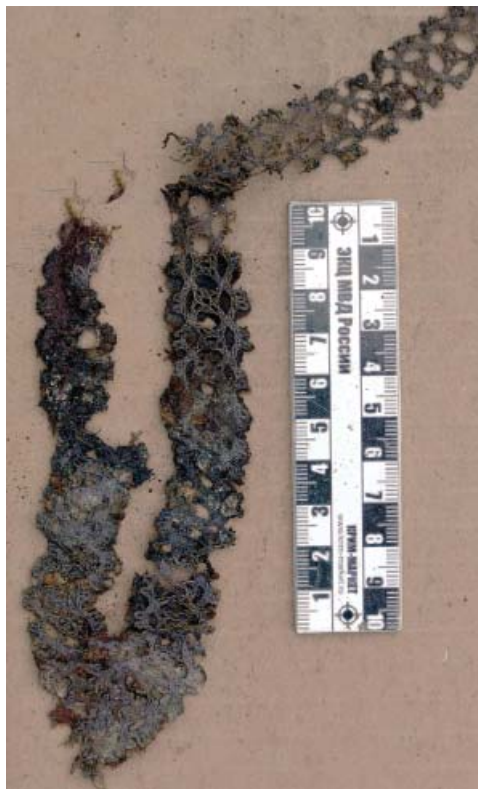
Рис. 2. Декоративная отделка ворота рубахи 4. Кружево на коклюшках.