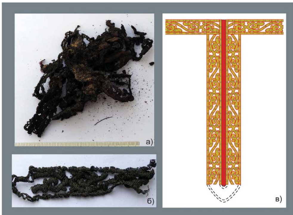
Рис. 1. Декоративная отделка рубахи 1: а – текстильные остатки после изъятия из грунта; б – фрагмент декоративной отделки: золотное шитье в прикреп; в – графическая реконструкция ворота.