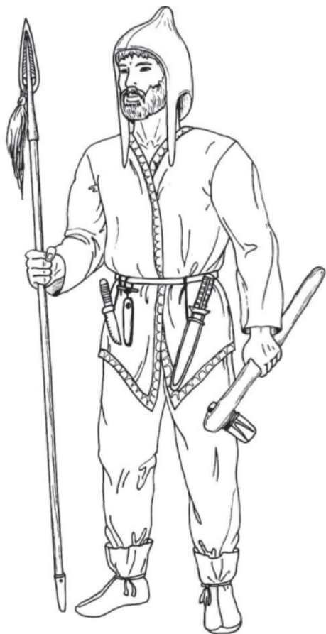
Рис. 2. Гипотетическая реконструкция мужского костюма и вооружения ананьинского воина на материалах погребений Мурзихинских могильников (художник Р.Р. Садыков, с изменениями Е.Н. Тимофеевой).

Fig. 2. A hypothetical reconstruction of a men's costume and the armament of an Ananyino warrior on the basis of materials from Murzikha burial grounds (artist R.R. Sadykov, amended by E.N. Timofeeva).