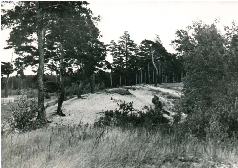
Рис. 2. Майданская стоянка, 1956 г.