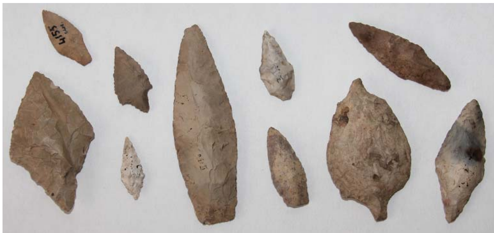
Рис. 2. Находки периода каменного века из собрания А.Ф. Лихачева. НМ РТ.