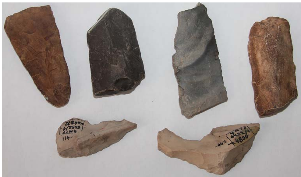
Рис. 4. Находки периода каменного века из окрестностей Казани из собрания А.Ф. Лихачева. НМ РТ.