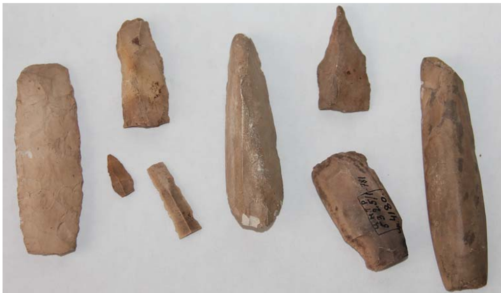
Рис. 3. Находки из Бакалдинской стоянки приказанской культуры из собрания А.Ф. Лихачева. НМ РТ.

Fig. 3. Findings discovered at Bakalda site of the Prikazanskaya culture from A. F. Likhachev's collection. National Museum of the Tatarstan Republic.