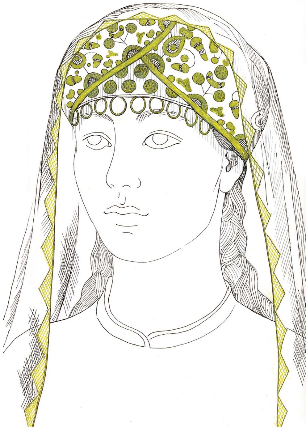
Рис. 5. Реконструкция головного убора – тюрбана (XIV в.). Художник-исполнитель Л. Ф. Фасхутдинова.