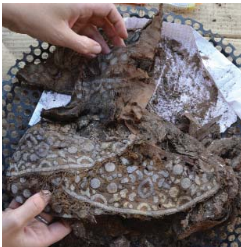
Рис. 1. Вид головного убора из погребения.