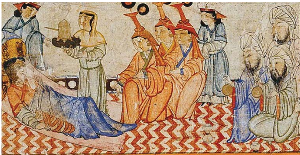
Рис. 6. Миниатюра из «Легенды о Газане»: рождение Газана (нач. XIV в.).