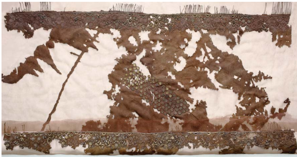
Рис. 2. Сетчатое покрывало с золотым шитьем.