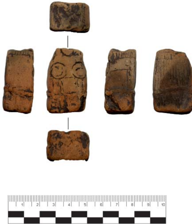
Рис. 1. Фигурка из разведочного шурфа на Татарско-Суксинском поселении.

Fig. 1. Figurine found in a prospective trench on the Tatarskie-Suksy settlement.