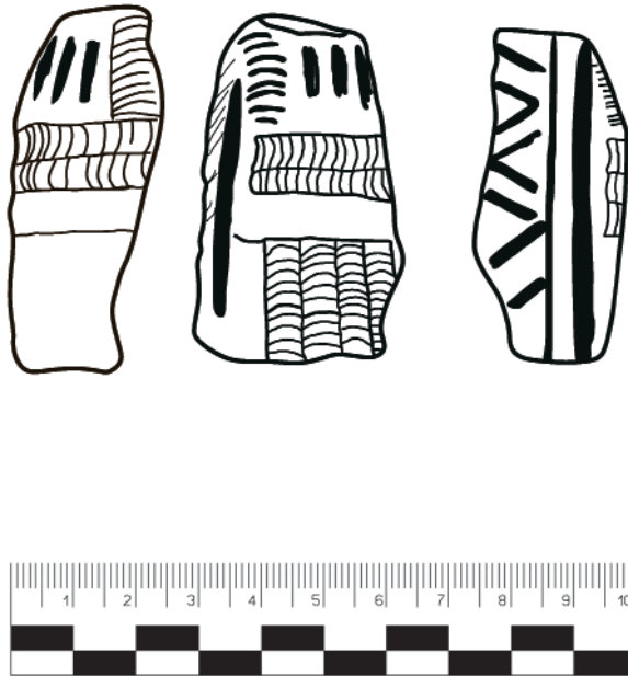
Рис. 3. Фигурка из Подгорно-Байларского III селища (по Генинг В.Ф., 1971).