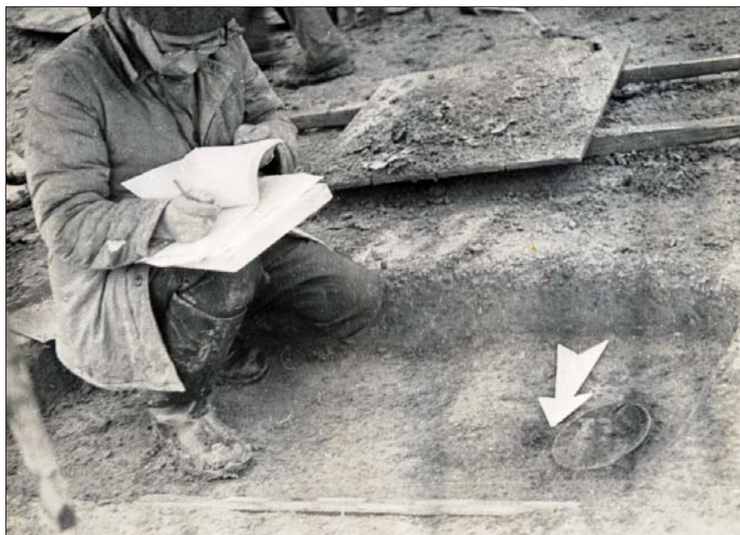
А.Х. Халиков на раскопках (1970-е гг.).