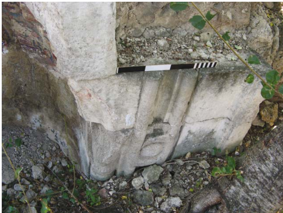
Рис. 6. Ремонтная вставка с западной капителью и частью орнамента михраба. Вид с северо-востока, сверху. 2012 г.

Fig. 6. Repaired insertion, with the western capital and a fragment of ornamentation of the mihrab. North-eastern view, from above. 2012.