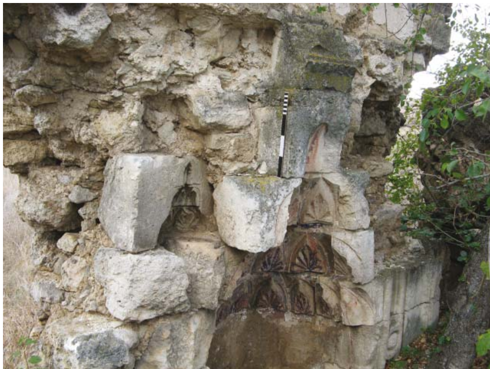
Рис. 10. Архитектурная деталь с конхой внутри кладки михраба. Вид с северо-востока. 2015 г.

ig. 10. Architectural fragment with a conch inside the mihrab's masonry. View from the north-east. 2015.