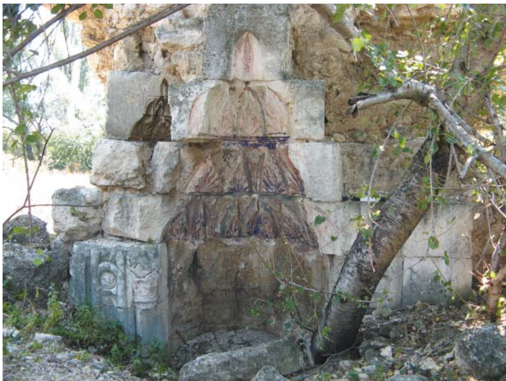
Рис. 1. Михраб. Вид спереди, с севера. 2012 г.