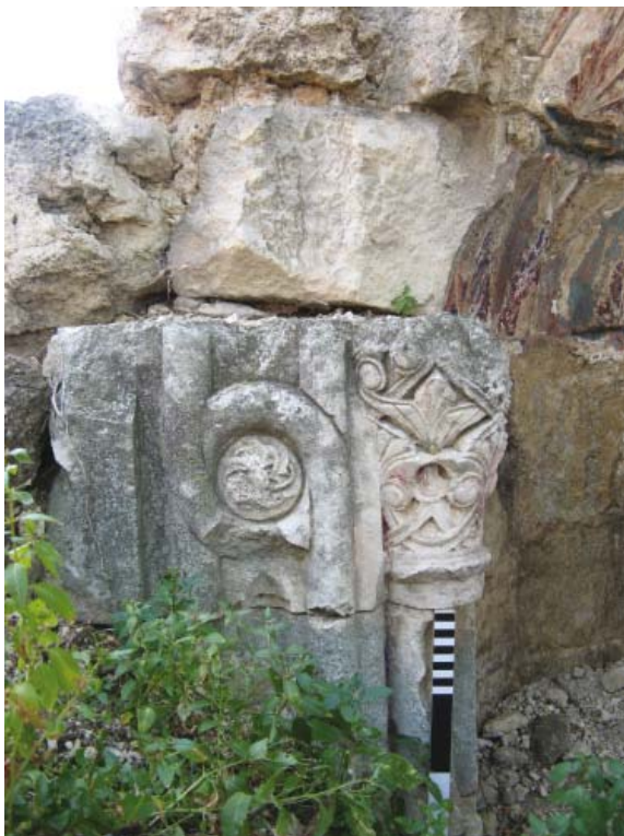
Fig. 3. Eastern capital of mihrab. Frontal view, from the north. 2012.