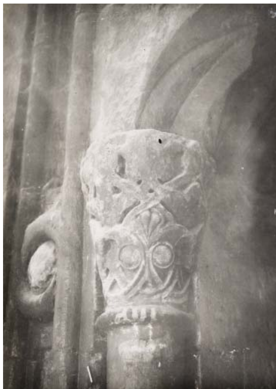
Рис. 4. Восточная капитель михраба. Вид с северо-запада. 1928 г. Автор неизвестен (ГНИМА, 1928, КПнвф 1143/3).