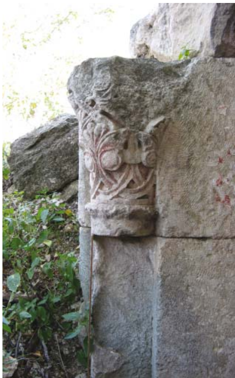
Рис. 5. Восточная капитель михраба. Вид сбоку, с запада. 2012 г.

Fig. 5. Eastern capital of mihrab. Lateral view, from the west. 2012.