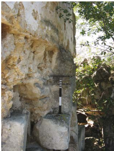
Рис. 7. Кладка михраба в верхней части. Вид сбоку, с востока. 2012 г.

Fig. 7. Masonry of the mihrab, upper part. Lateral view, from the east. 2012.