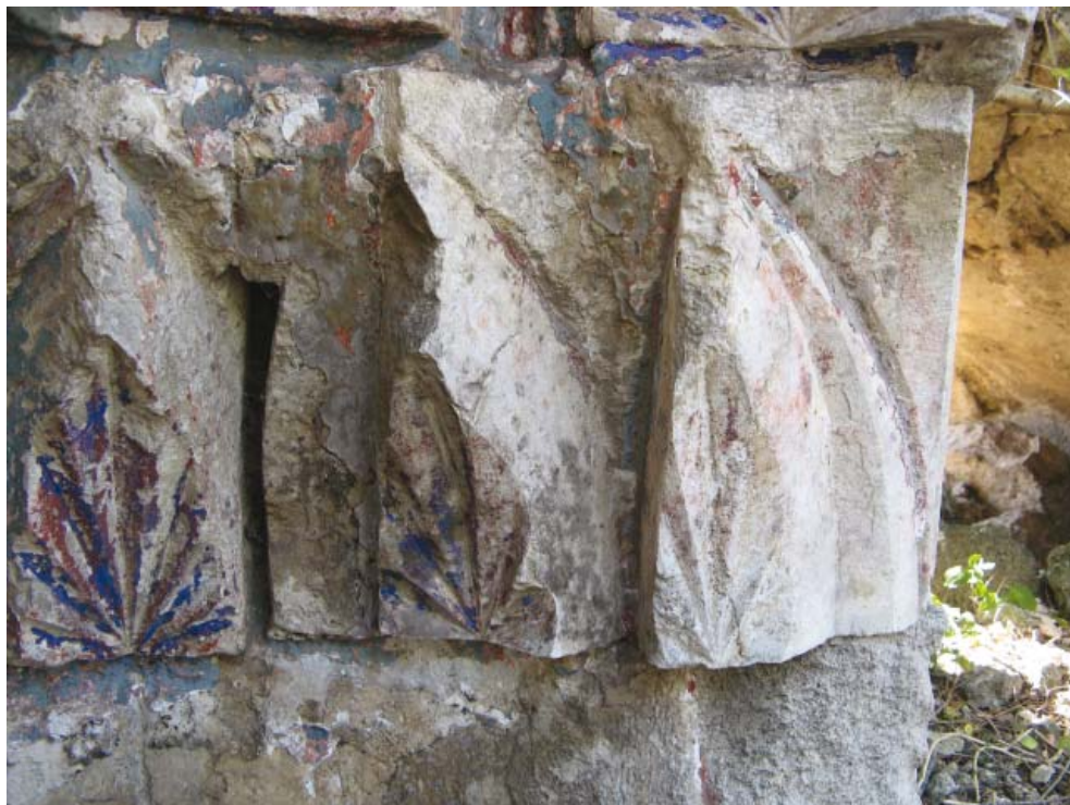
Рис. 9. Ремонтная подтёска сталактитов нижнего яруса свода. Вид с востока. 2012 г.