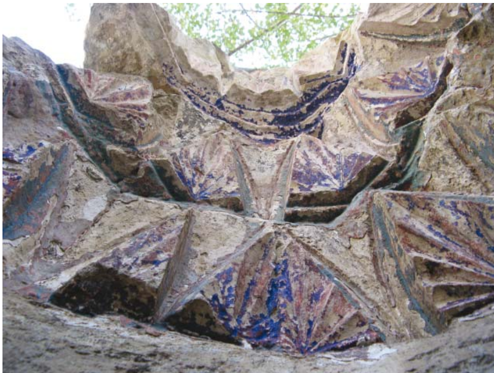
Рис. 8. Перекрытие михрабной ниши. Вид снизу, с юга. 2012 г.