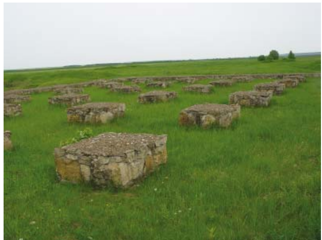
Fig. 6. White stone part of the mosque, reconstruction. Modern view.