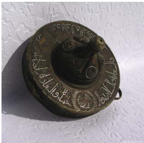
Рис. 2. Крышка чернильницы. Бронза. XI–XIII вв. МБЦ БГИАМЗ.

Fig. 2. Lid of an ink-pot. Bronze. 11 th – 13 th centuries (Exhibition at the Museum of Bolgar Civilization. Bolgar State Historical and Architectural Reserve).