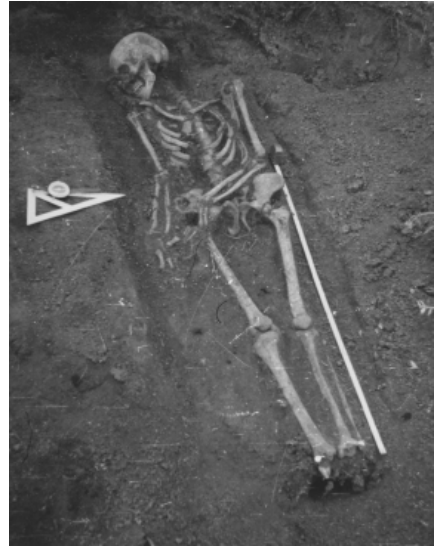
Рис. 9. Мусульманские погребения Спасского (Старокуйбышевского) могильника (раскопки автора, 1987).