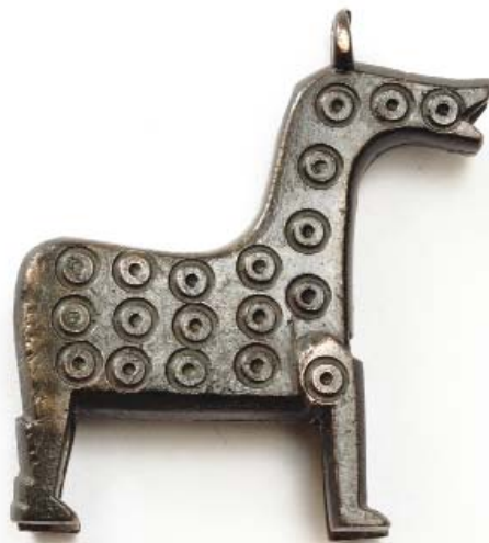
Fig. 3. A snap shaped as a horse. Bronze. 11 th – 13 th centuries (Exhibition at the Museum of Bolgar Civilization. Bolgar State Historical and Architectural Reserve).