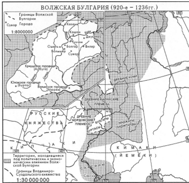
Рис. 1. Карта основной территории Волжской Булгарии.