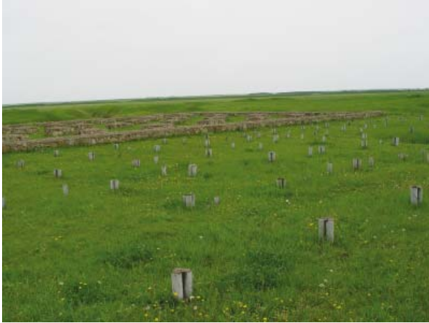
Рис. 5. Реконструкция деревянной части мечети. Современный вид.

Fig. 5. Reconstruction of the wooden part of the mosque. Modern view.