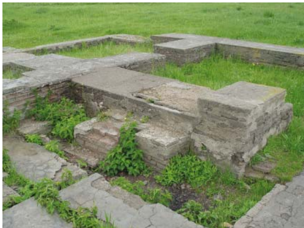
Рис. 7. Реконструкция белокаменной бани. Современный вид.

Fig. 7. White stone bath, reconstruction. Modern view.