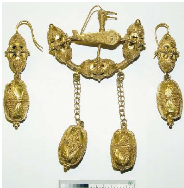
Рис. 1. Майкарские находки, особая кладовая ГЭ, № 544.