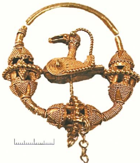
Рис. 2. Височное кольцо из Верхнечусовских Городков.

Технология изготовления этих колец подробно разобрана В.П. Новиковым, В.С. Павловым и К.А. Руденко (Новиков, Павлов, 1991, с. 183–185; Руденко, 2002). Сканые узоры были выполнены из «веревочки» – скрученного из двух проволок жгута и «шнурка» – скрученного из трех или четырех проволок или из двух «ве-