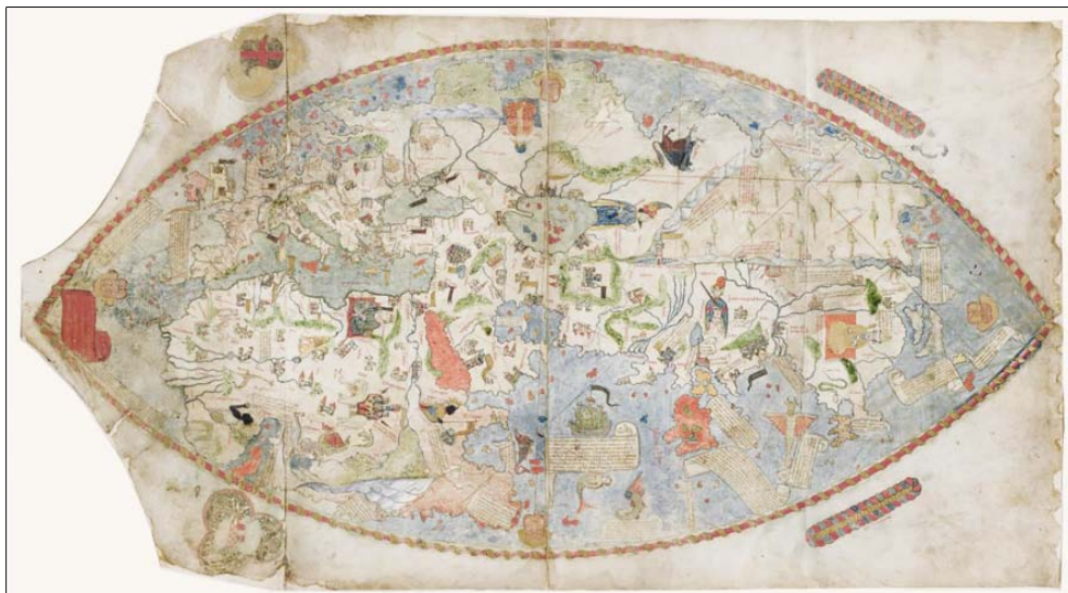
Рис. 1. Общий вид Генуэзской карты 1457 г.