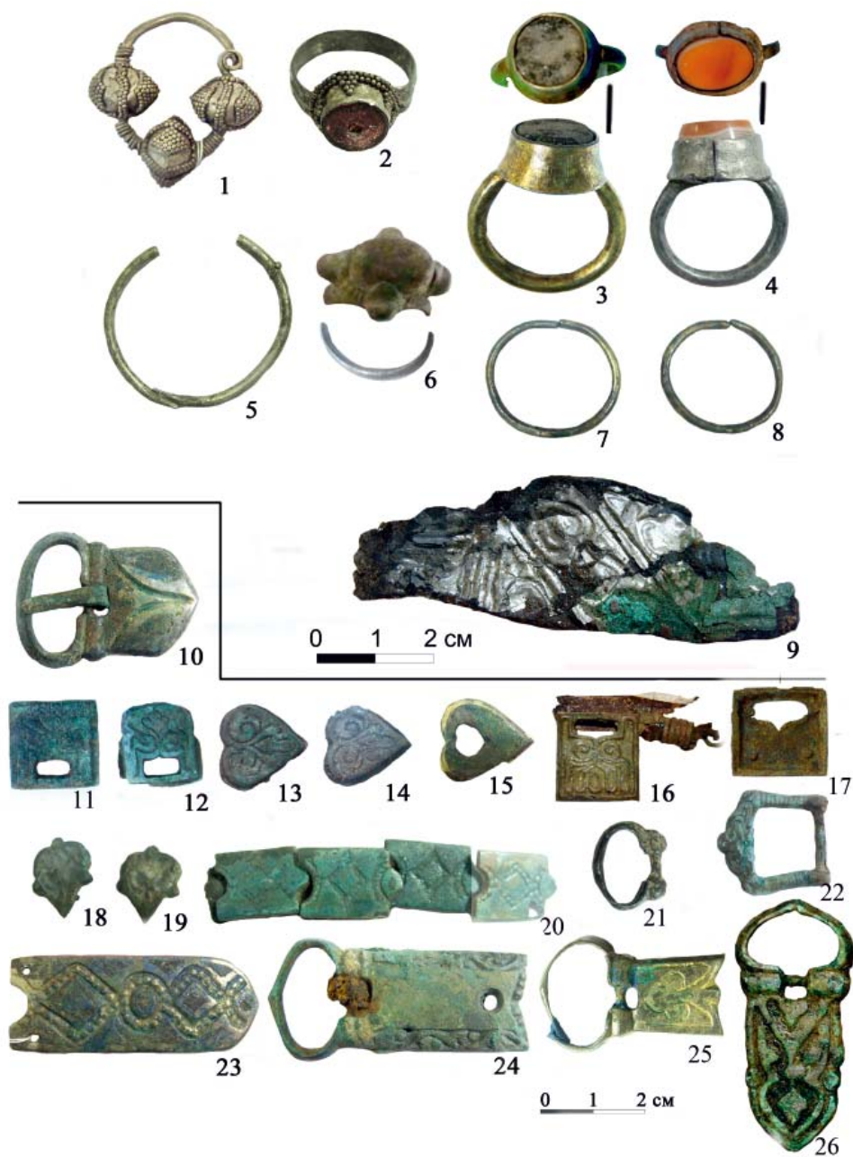
Рис.5. Анаткасинский могильник: 1–2, 4, 15, 20–21, 23, 25 – погребение 6; 3, 5, 9, 24 – погребение 7; 6 – погребение 18; 7–8 – погребение 23; 10 – погребение 8; 11–14 – погребение 10; 16 – погребение 4, 17 – погребение 14; 18–19 – погребение 17; 22 – погребение 11; 26 – погребение 1.