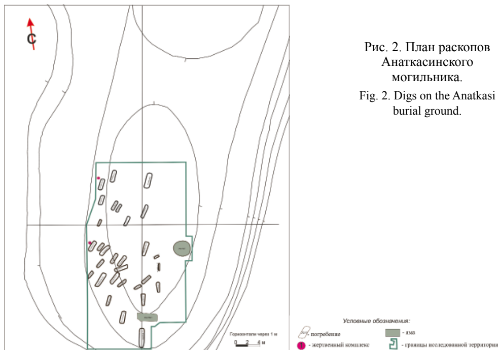
Рис. 2. План раскопов Анаткасинского могильника.