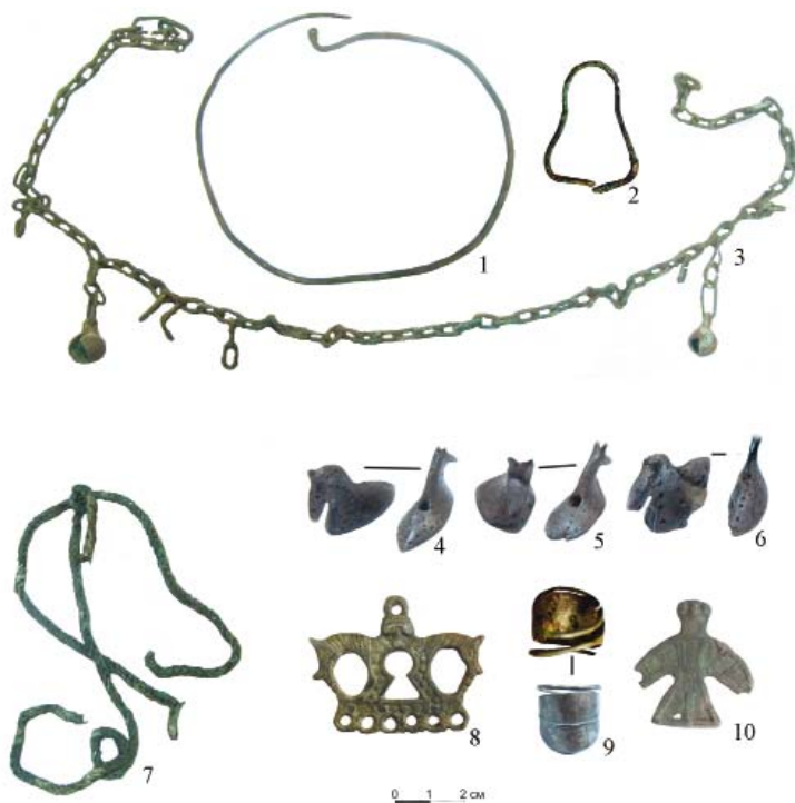
Рис.3. Анаткасинский могильник: 1 – погребение 22; 2, 7 – погребение 17; 3 – жк 1; 4–6, 8 – погребение 10; 9 – пп. 11, 18; 10 – яма 1.