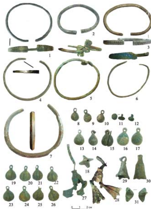
Рис.4. Анаткасинский могильник: 1–3 – погребение 6; 5 – жк 1; 4, 8–10 – погребение 8; 6–7 – погребение 7; 11–12 – погребение 23, 29; 13–18, 29–31 – погребение 17; 19–27 – жк 2; 28 – погребение 3.