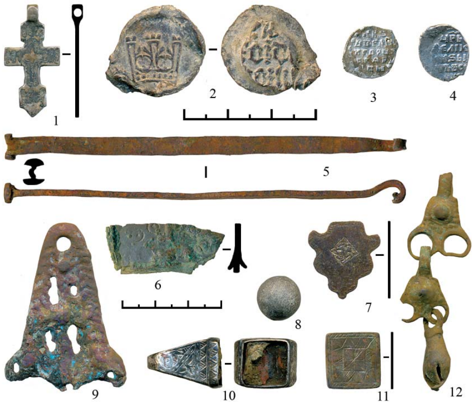
Рис. 3. Находки с городища Искер. 1, 3, 4, 10 – серебро, 2, 8 – свинец, 5, 7, 11, 12 – медь, 6, 9 – бронза.