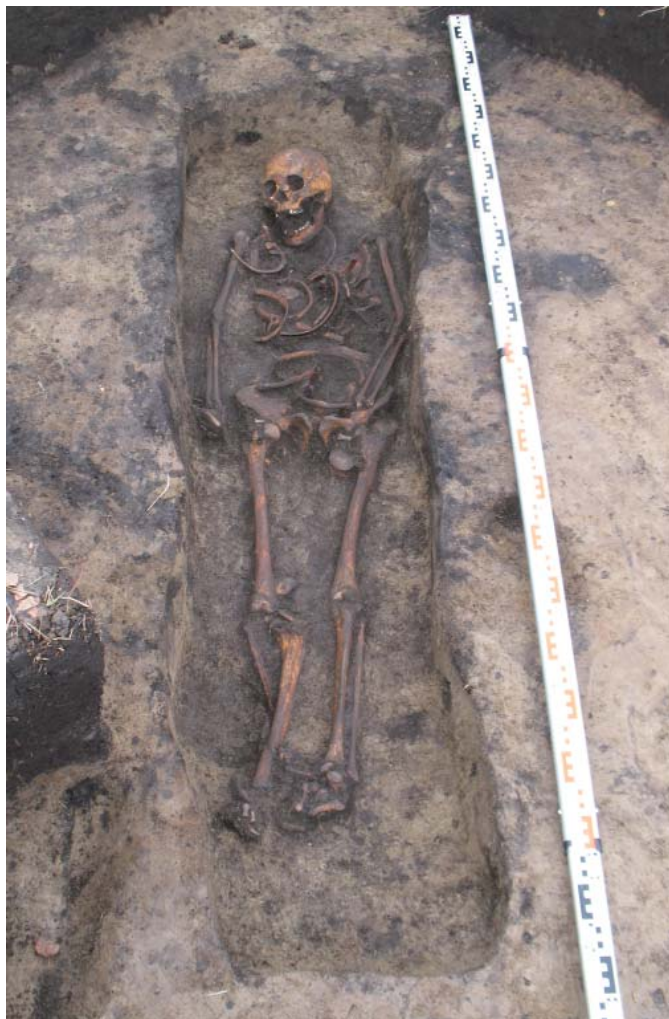
Рис. 2. Могильник Искер. Погребение. Fig. 2. Isker burial ground. Inhumation.

20 лет, которая в расовом отношении, скорее всего, не являлась европейцем.