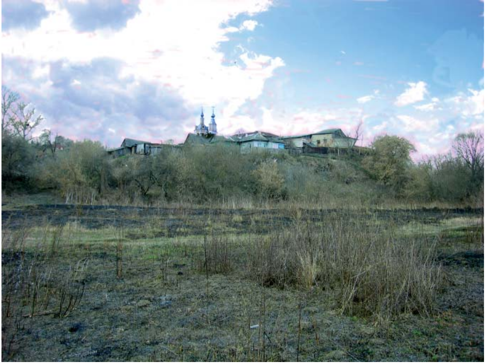
Рис. 3. Козельск. Холм в устье р. Другусны. Fig. 3. Kozelsk. A hill in the mouth of Drugusna river.