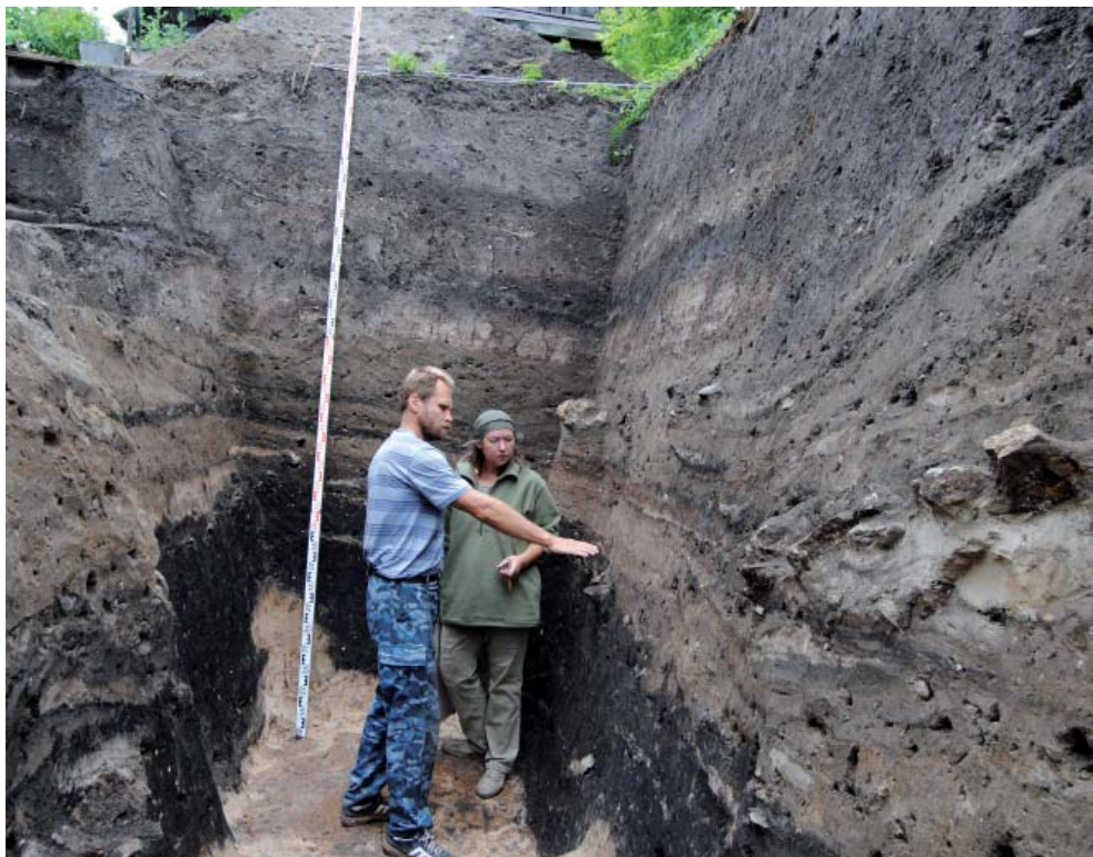
Рис. 7. Рабочий момент. Козельск, раскоп 2014 г. Fig. 7. On-the-job situation. Kozelsk, 2014 excavation.