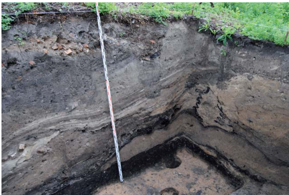
Рис. 8. Козельск. Следы пожара в профилях стенок раскопа 2014 г. Fig. 8. Kozelsk. Traces of fire in the pit walls cross-sections. 2014 excavation.