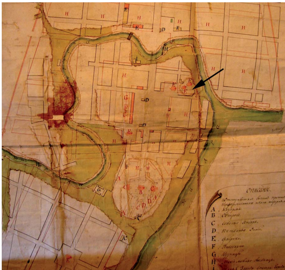
Рис. 1. План г. Козельска в Атласе Калужского наместничества 1782 г.

Fig. 1. Plan of the town of Kozelsk in the 1782 Atlas of Kaluga gubernia.