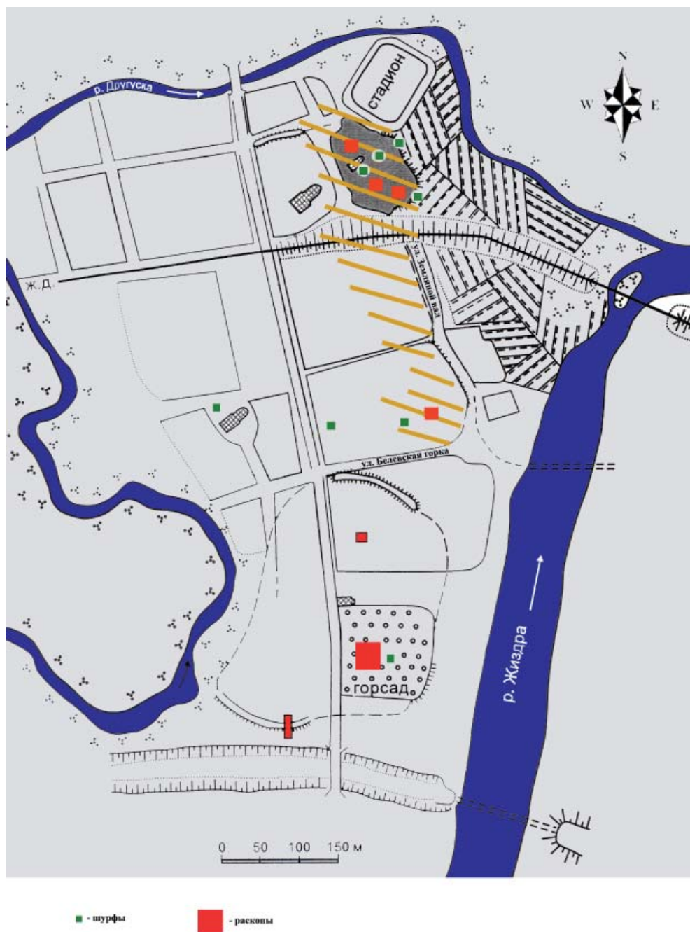
Рис. 2. Схема расположения шурфов, раскопов и распространения древнерусского культурного слоя (штриховка) в исторической части г. Козельска.