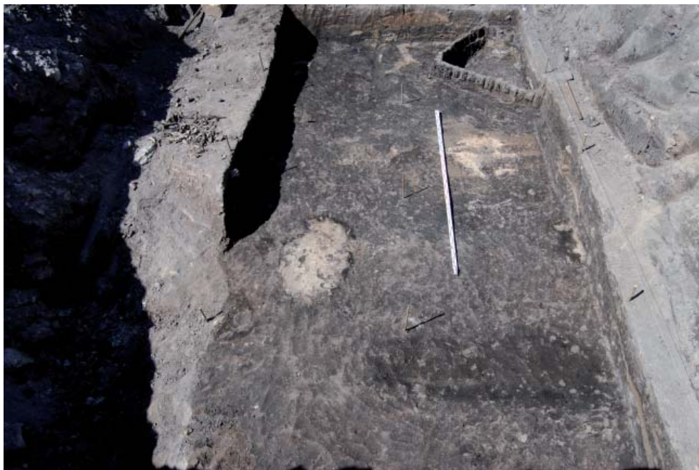
Рис. 5. Остатки бревенчатого сооружения и долбленной колоды. Козельск, раскоп 2011 г.