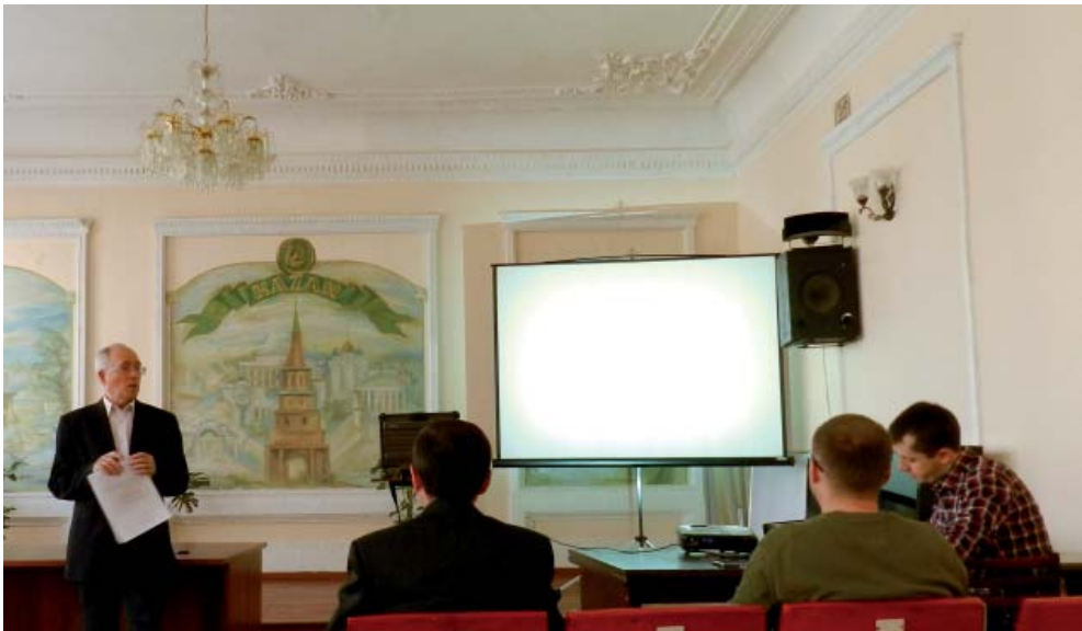
Рис. 4. Сотрудники отдела средневековой археологии. Fig. 4. Staff members, Department of medieval archaeology.