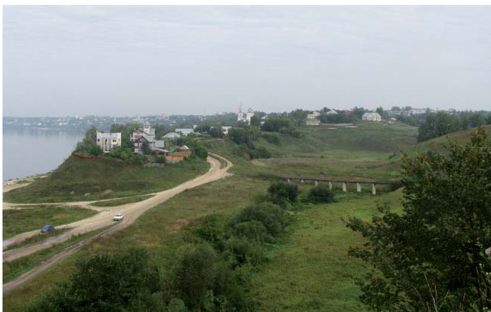
Рис. 7. Город Касимов, Рязанская область. Fig. 7. City of Kasimov, Ryazan oblast.