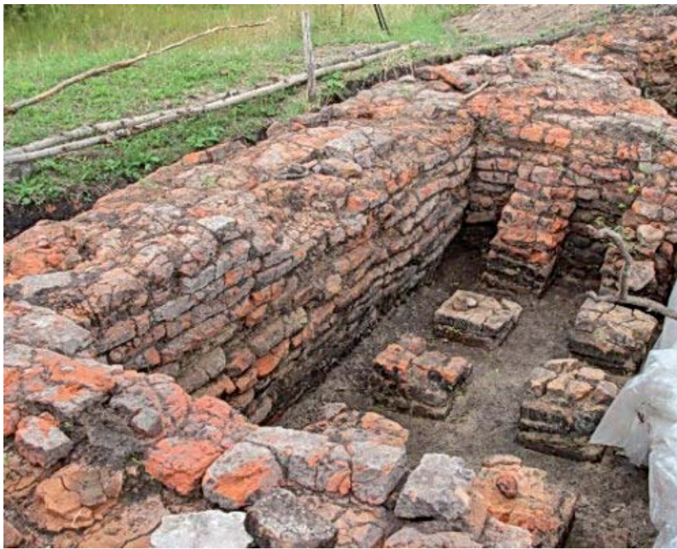
Рис. 9. Красносюндюковское городище, руины бани XI–XII вв., Ульяновская область. Fig. 9. Krasnyi Syundyuk hill fort site, ruins of the 11–12-century bath, Ul'yанovsk oblast.

ению методики обработки и анализа кремнированных и кальцинированных человеческих останков. З.Г. Шакиров прошел обучение по программе сохранения Всемирного культурного наследия «General Introduction to the UNESCO World Heritage Convention» и «Strategic Planning for Cultural Heritage and Management Plans» и получил Сертификат Бранденбургского технического университета.