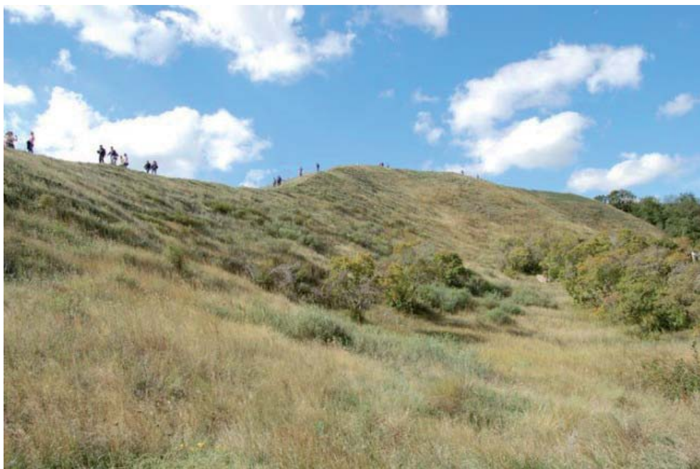
Рис. 8. Городище Укек, Саратовская область.

Практическим воплощением и апробацией комплекса научных направлений Института археологии стала организация и проведение полевой Международной археологической школы в г. Болгар (см. более подробно: ПА. – 2014. – № 4. – С. 294–303).