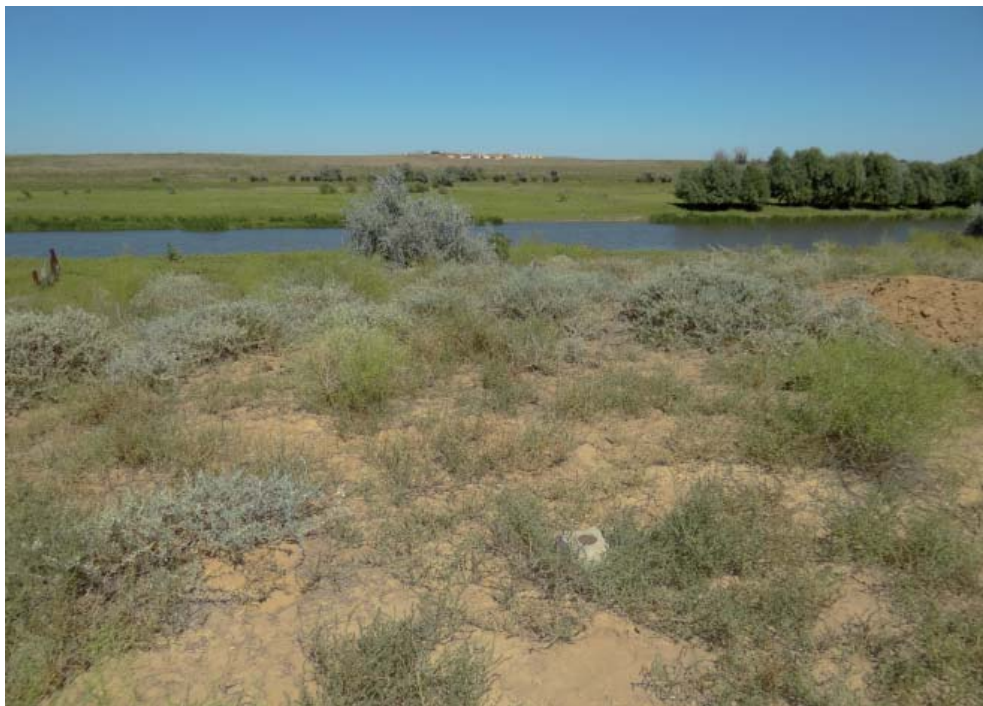
Рис. 5. Городище Красный Яр, Астраханская область.

Fig. 5. Krasnyi Yar hill fort site? Astrakhan oblast.