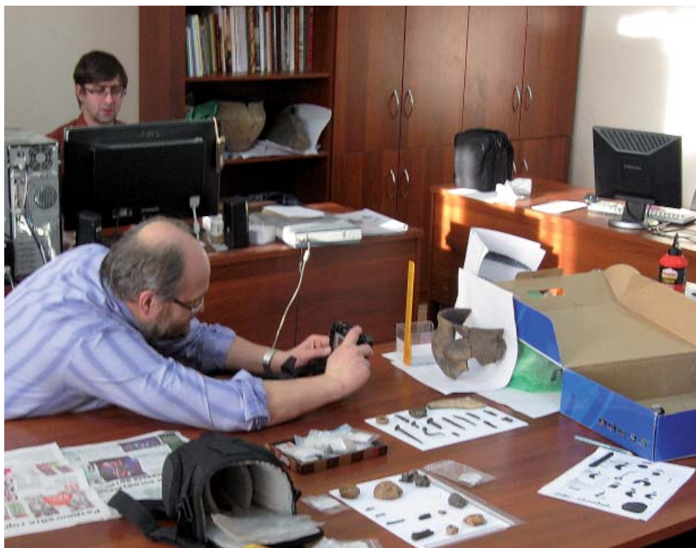
Рис. 2. Сотрудники отдела первобытной археологии. Fig. 2. Staff members, Department of prehistoric archaeology.

2. Научное направление «Средневековая тюрко-татарская цивили-