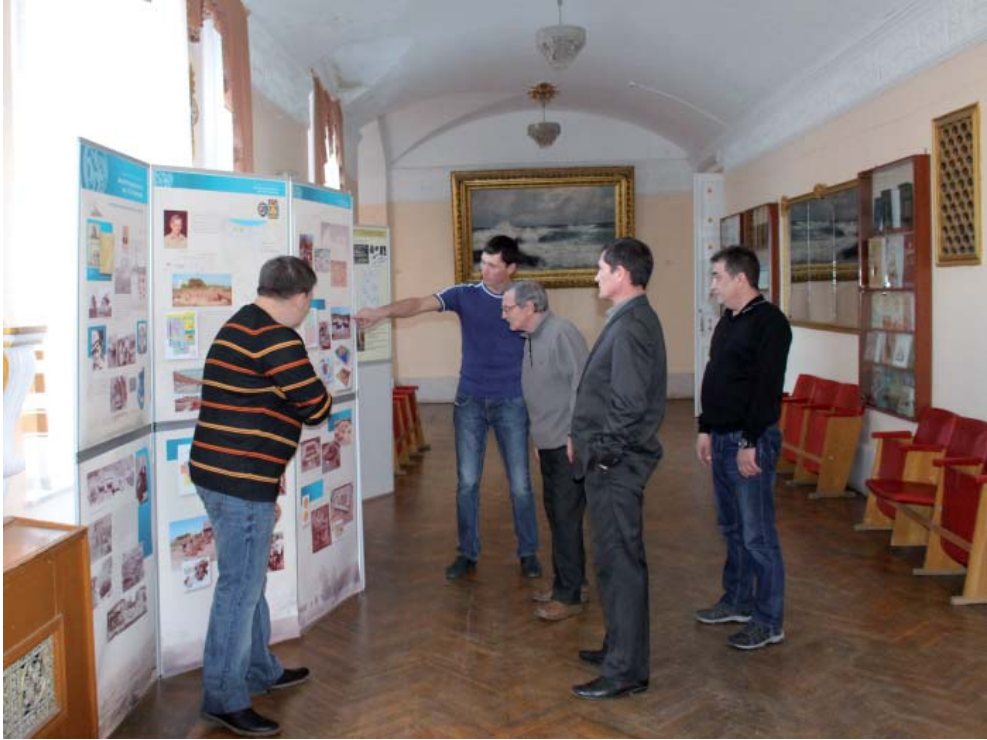
Рис. 3. Сотрудники отдела средневековой археологии. Fig. 3. Staff members, Department of medieval archaeology.