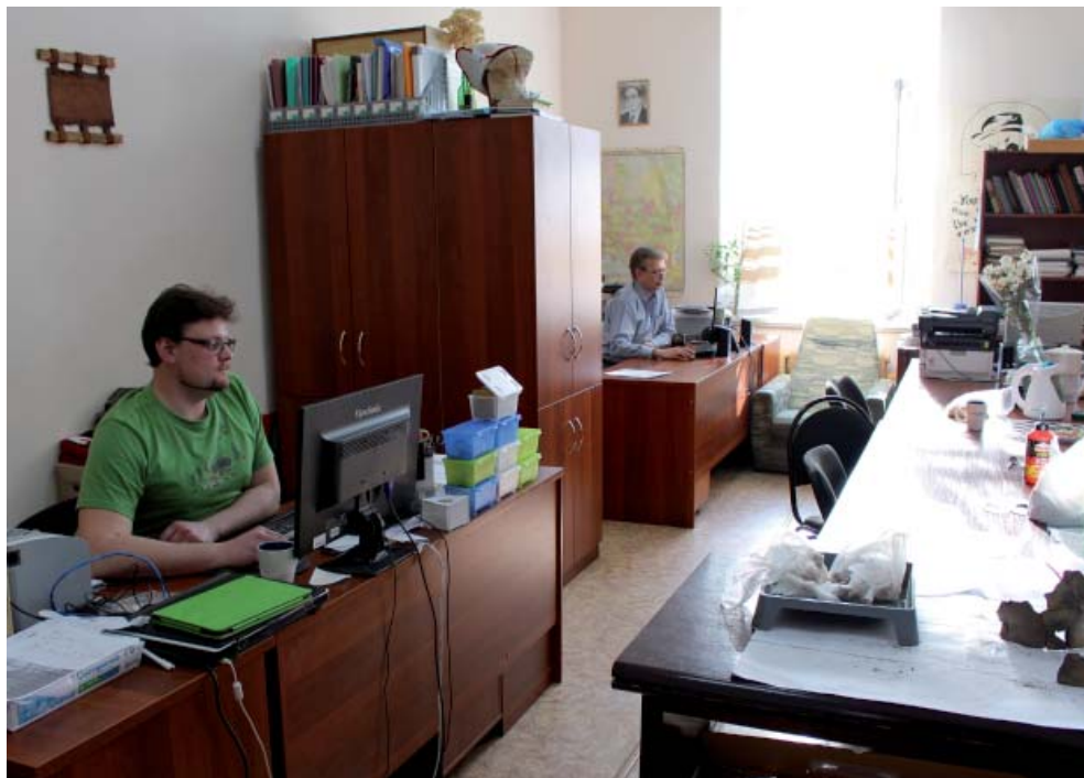
Рис. 1. Сотрудники отдела первобытной археологии.