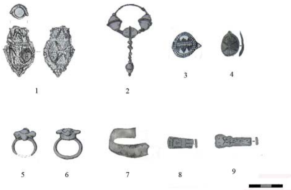
Рис. 1. Городище Иднакар. Изделия из цветных металлов (по М. Г. Ивановой): 1 – отливка подвески с грушевидным окончанием; 2 – трехбусинное височное кольцо; 3,4 – щитковые перстни; 5,6 – цельнолитые перстни со вставками; 7,8,9 – пластинчатые браслеты.

и несколько отличающиеся от основной массы предметов особенностями обработки – из качественной светлой кости, с хорошо отполированной поверхностью и часто имеющие циркульный орнамент» (Иванов, 1997, с. 135).