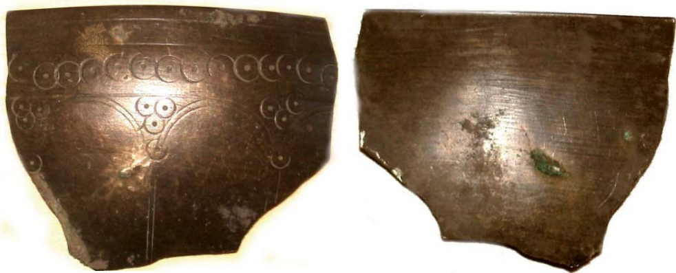
Рис. 1 Фрагмент чаши из окрестностей г. Ставрополя, 2010 г. Подъемный материал.